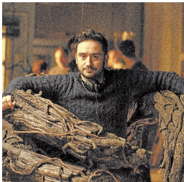
Juan A. Bayona, director de Un monstruo viene a verme